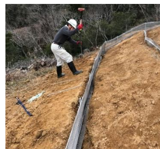
鋼製しがら設置状況