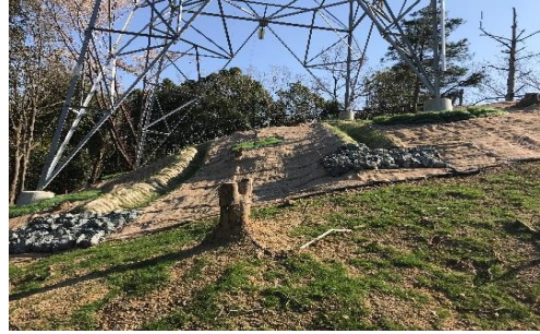
KODOBOKU 技術を活用した現場施工例