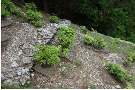
ストーンバッグとアセビ